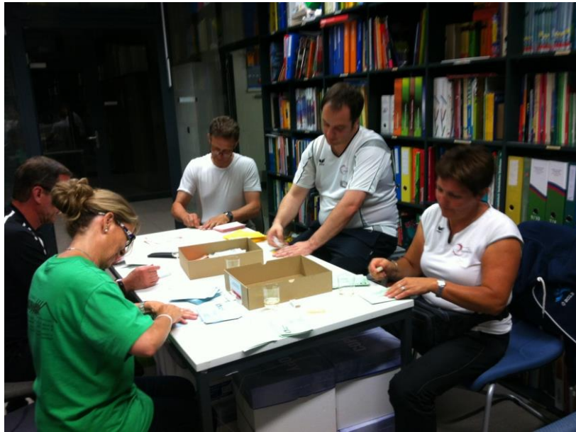
Ein kleiner Einblick in das Rechnungsbüro